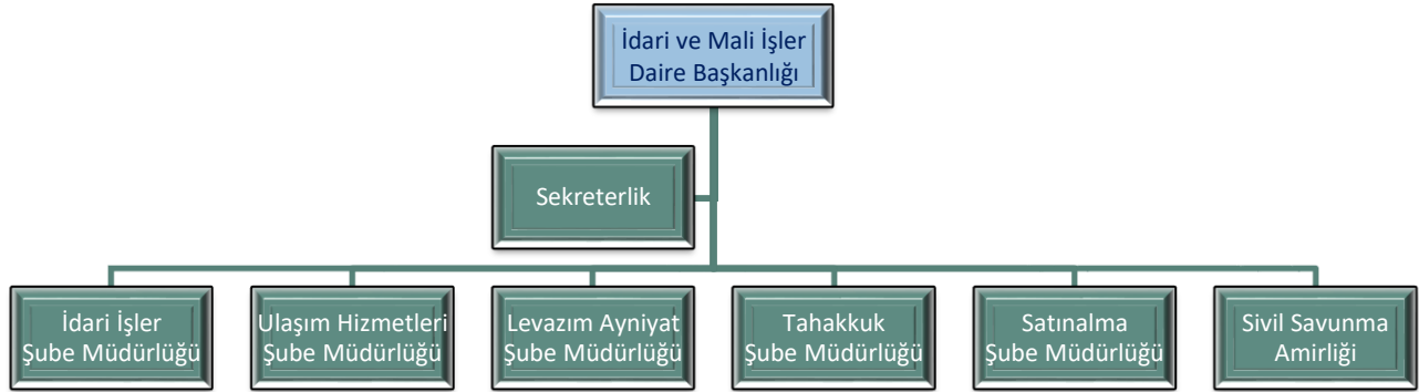
Şekil 1 Örgüt Yapısı (Teşkilat Şeması)