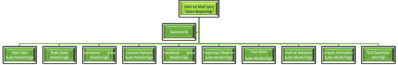
Şekil 1 Örgüt Yapısı (Teşkilat Şeması)