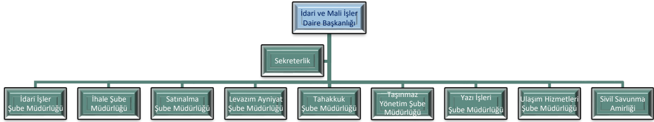
Şekil 1 Örgüt Yapısı (Teşkilat Şeması)